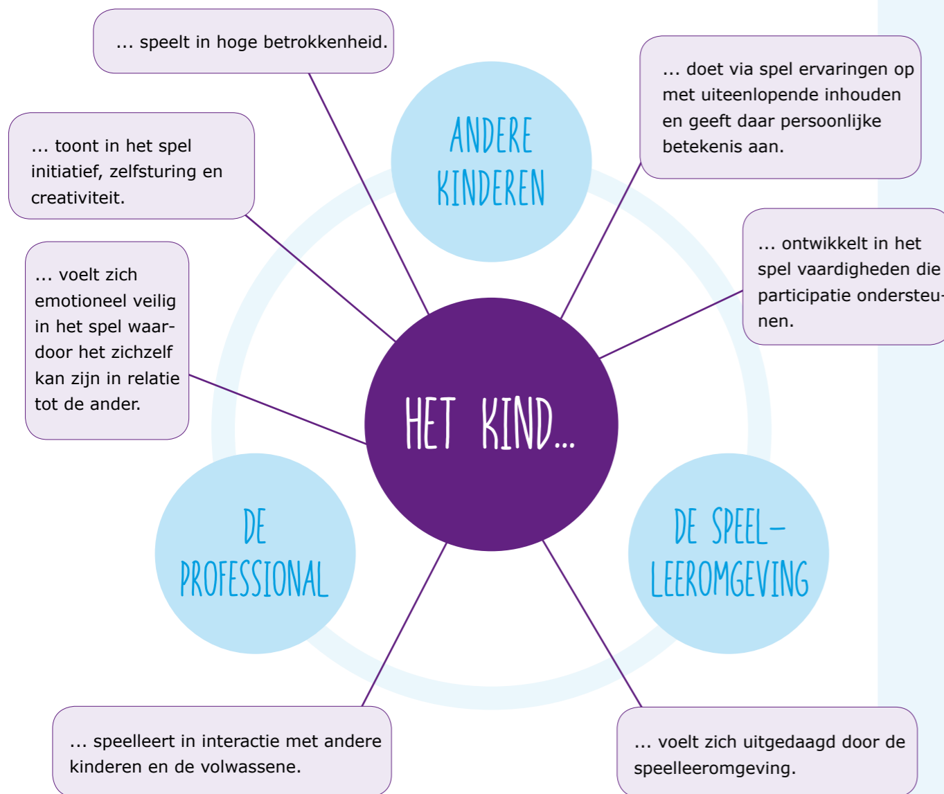
Figuur 2: Brede bedoelingen van het onderwijs aan jonge kinderen

In het onderzoek naar deze vraag wordt verder ingezoomd op de processen tussen het kind en zijn 'pedagogen', wat leidt tot specifieke en concrete deelvragen over spelend leren, zie Figuur 2. Daarbij valt te denken aan vragen als: Hoe kan de professional via een rijke speelleeromgeving de gewenste ontwikkelprocessen bij kinderen bewerkstelligen en beïnvloeden? En vanuit welke visie wil hij daarbij handelen? Hoe kan de professional in interactie en begeleiding van spel het kind ondersteunen? Hoe kan de professional kinderen stimuleren in het nemen en ontplooiën van eigen initiatief, zowel in handelen als in denken? Hoe kan de professional bijdragen aan het samen leren van kinderen in een veilige context, waarin pluraliteit uitgangspunt is?